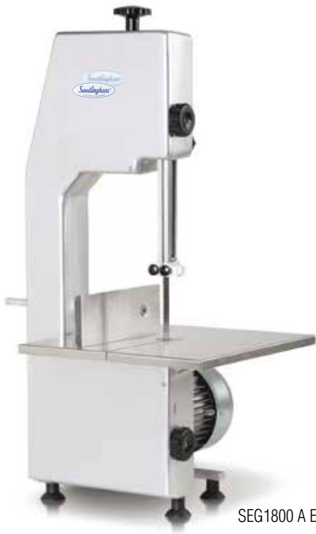
SEG1800 A EXP

Export bone bandsaws / Scie à os export / Knochensäge Export / Sierras de cinta pas huesos export