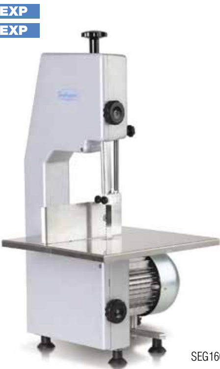
SEG1600 V EXP