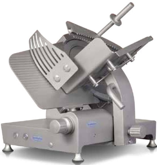
AF350 INGR I