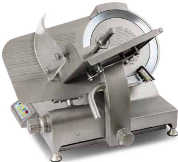
AF350 GRA I

S/steel gravity slicers / Trancheurs gravité en acier inox Edelstahl Schwerkraft-Aufschnittmaschinen / Cortadoras de fiambres de gravedad en acero inoxidable