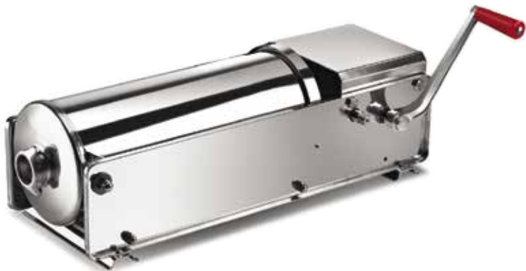
INS 7 O