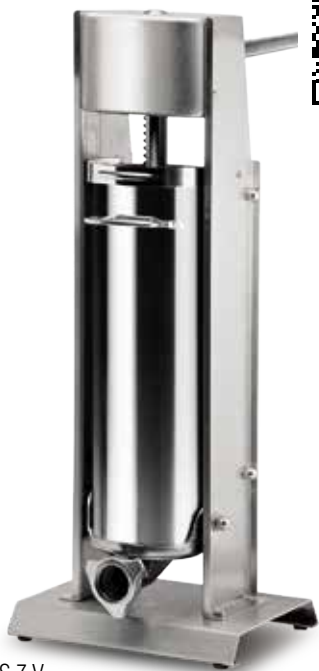
INS 7 V

Sausage stuffer / Poussoir à saucisse / Wurstfullmaschine / Embutidora